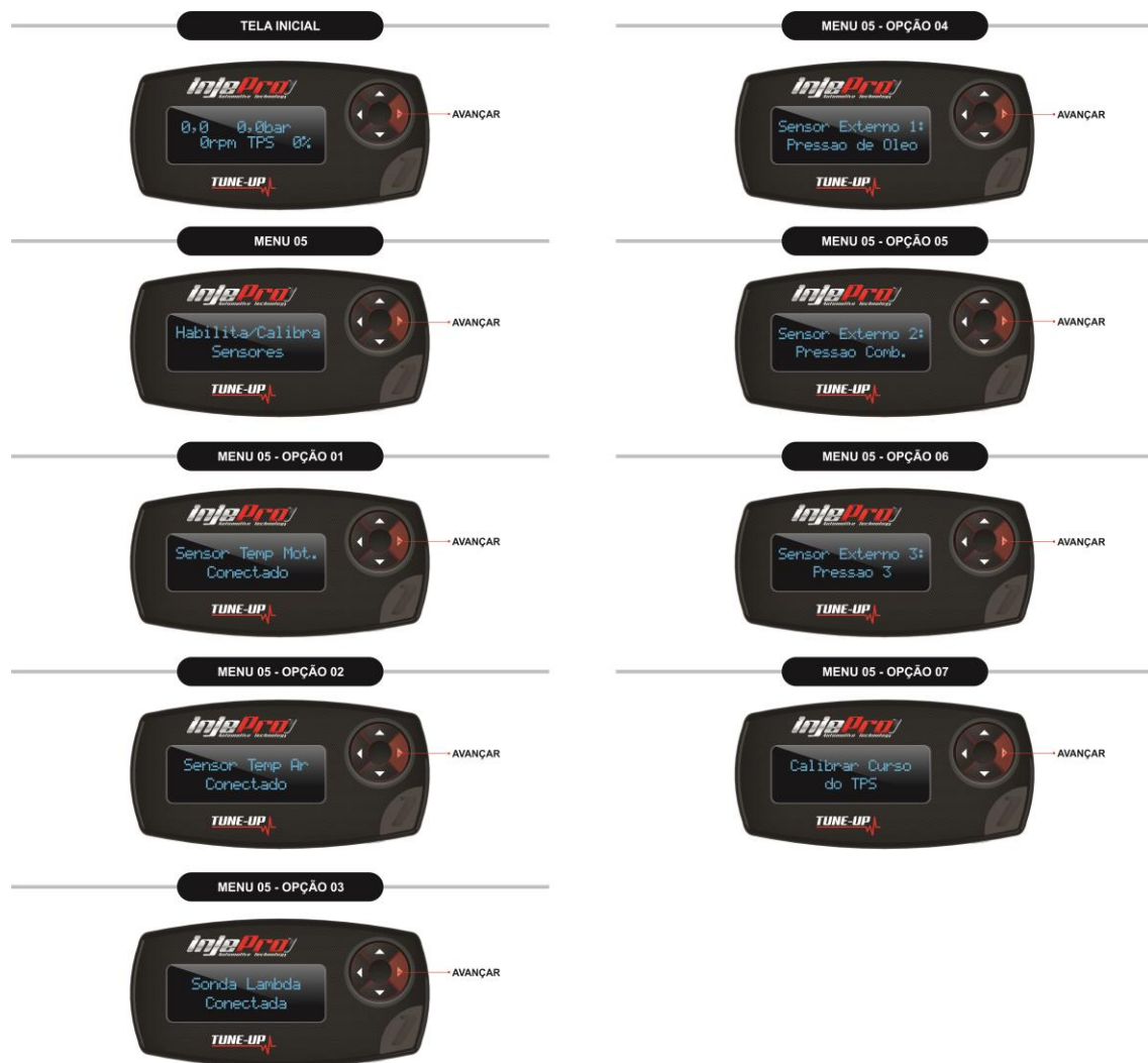
Figura 8 Opções do Menu Habilita/Calibra Sensores.