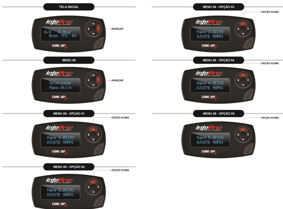
Figura 11 Opções do Menu Selecionar Mapa Ativo.