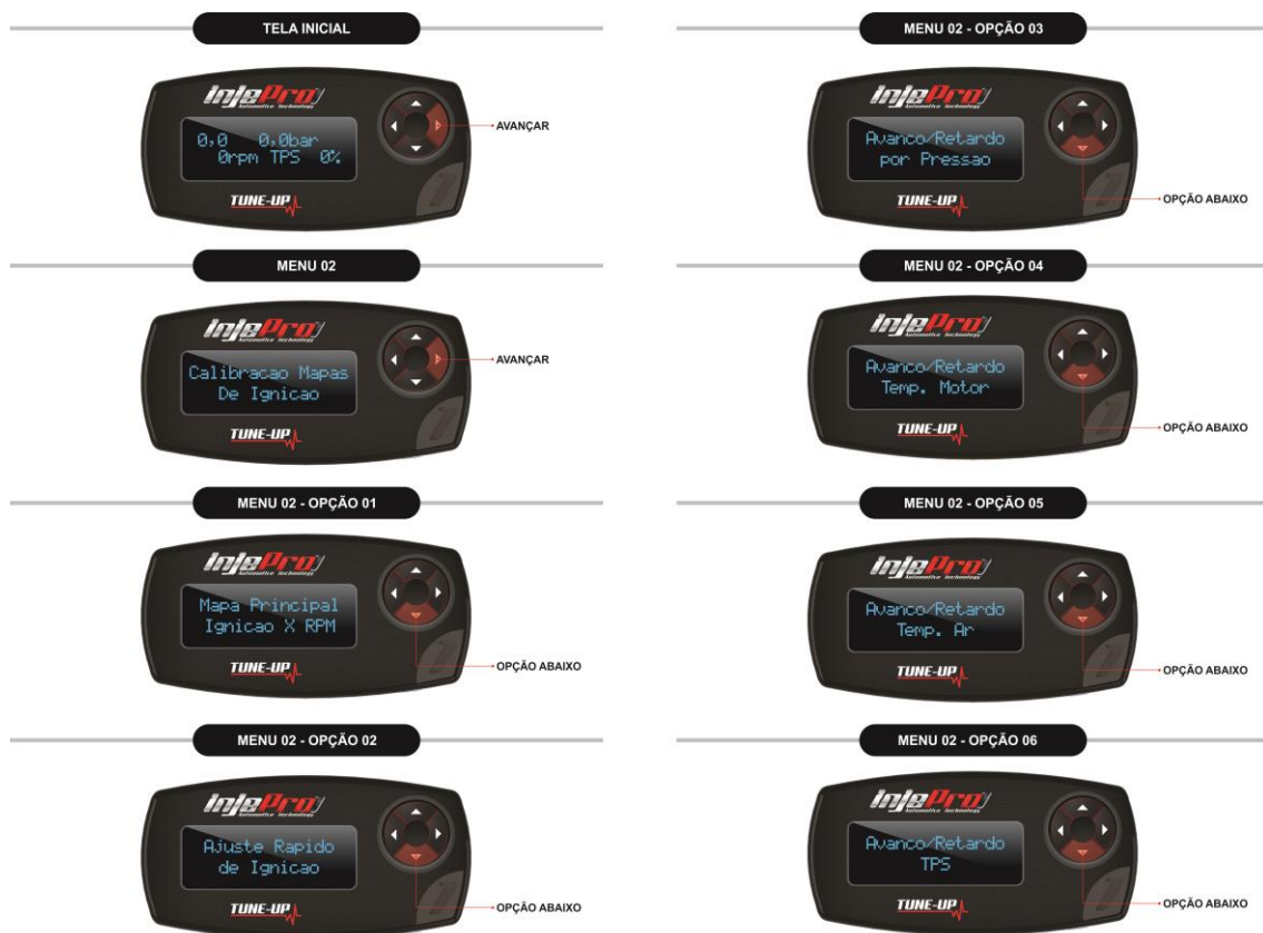
Figura 5 Opções do Menu de Calibração Mapas de Ignição.