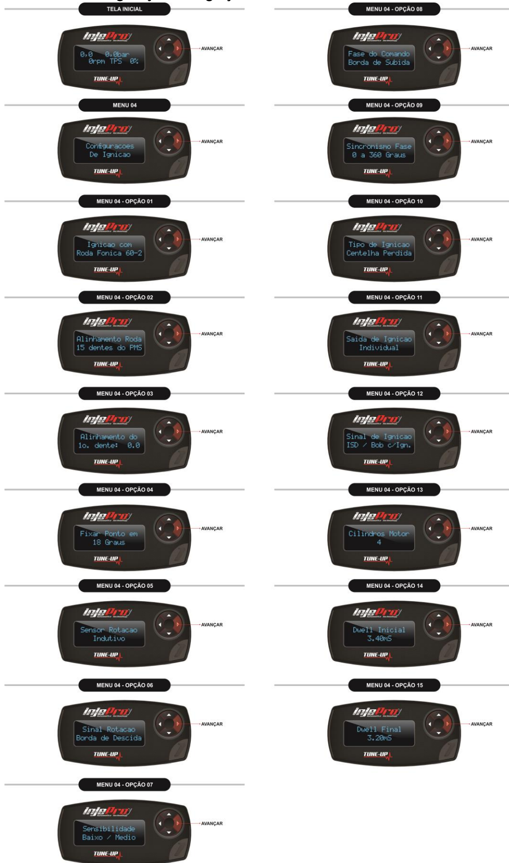
Figura 7 Opções do Menu Configurações de Ignição.