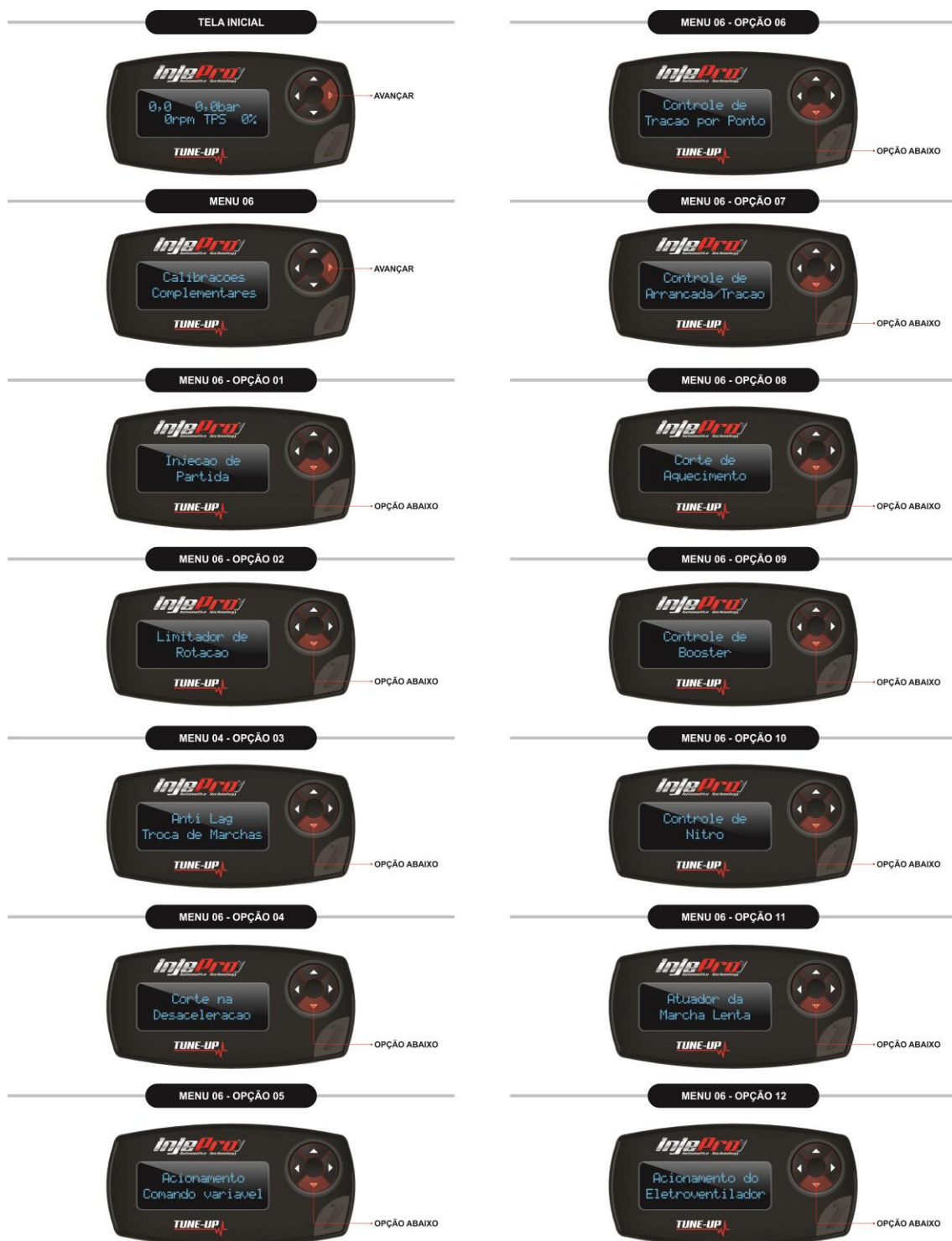
Figura 9 Opções do Menu Calibrações Complementares.