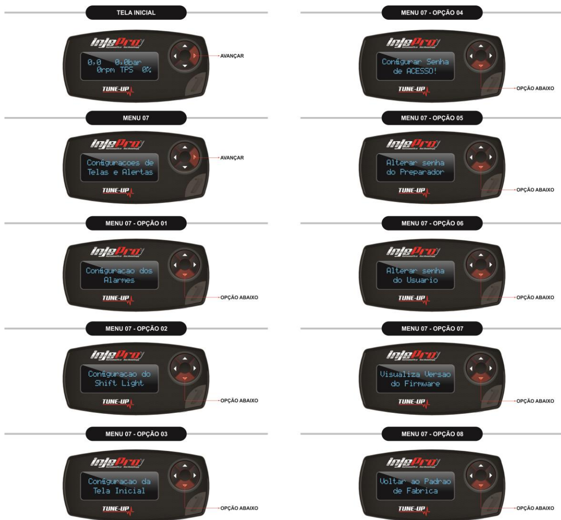
Figura 10 Opções do Menu Configurações de Telas e Alertas.