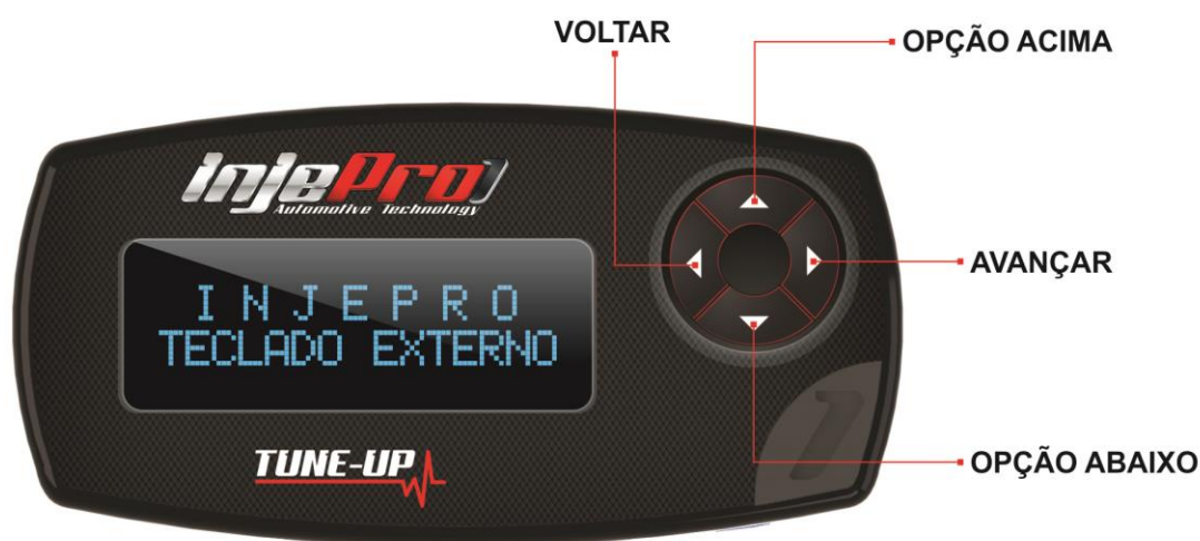
Figura 1 Visão frontal do teclado

O Tune-Up mostra somente dados que o módulo disponibiliza, dessa forma as informações disponíveis no Tune-Up destina-se exclusivamente ao módulo operante naquele momento. Segue um exemplo de visualização quando conectado a uma EFI-PRO V2.