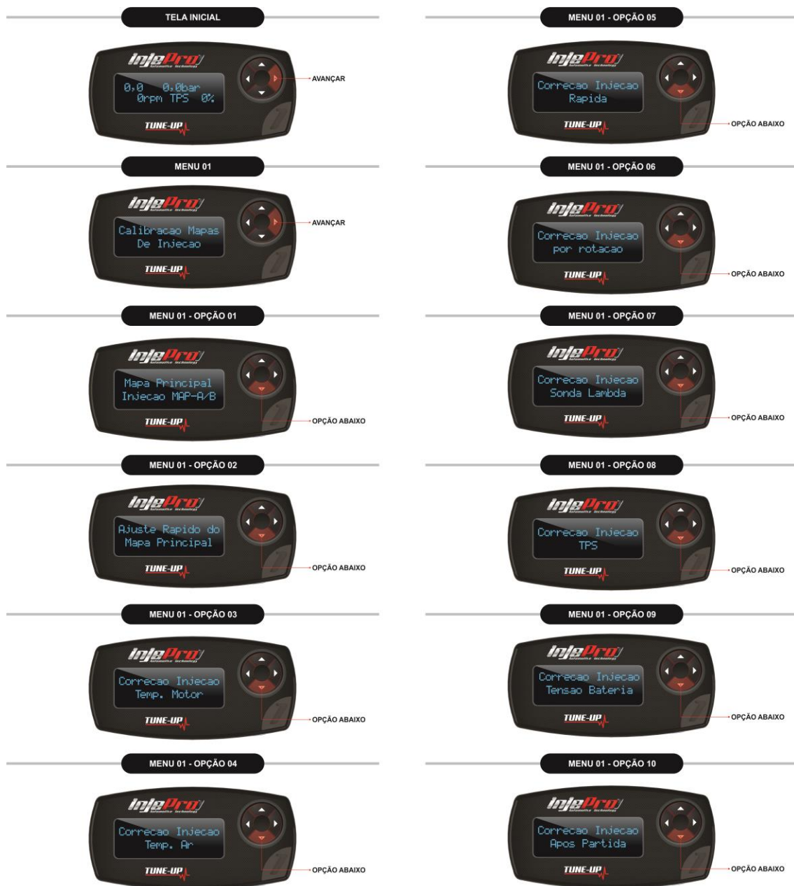
Figura 4 Opções do Menu de Calibração Mapas de Injeção.